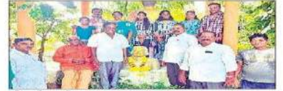
వేమగిరిలో కలాం విగ్రహానికి పుష్పాంజలి పులిస్తున్న ప్రముఖులు